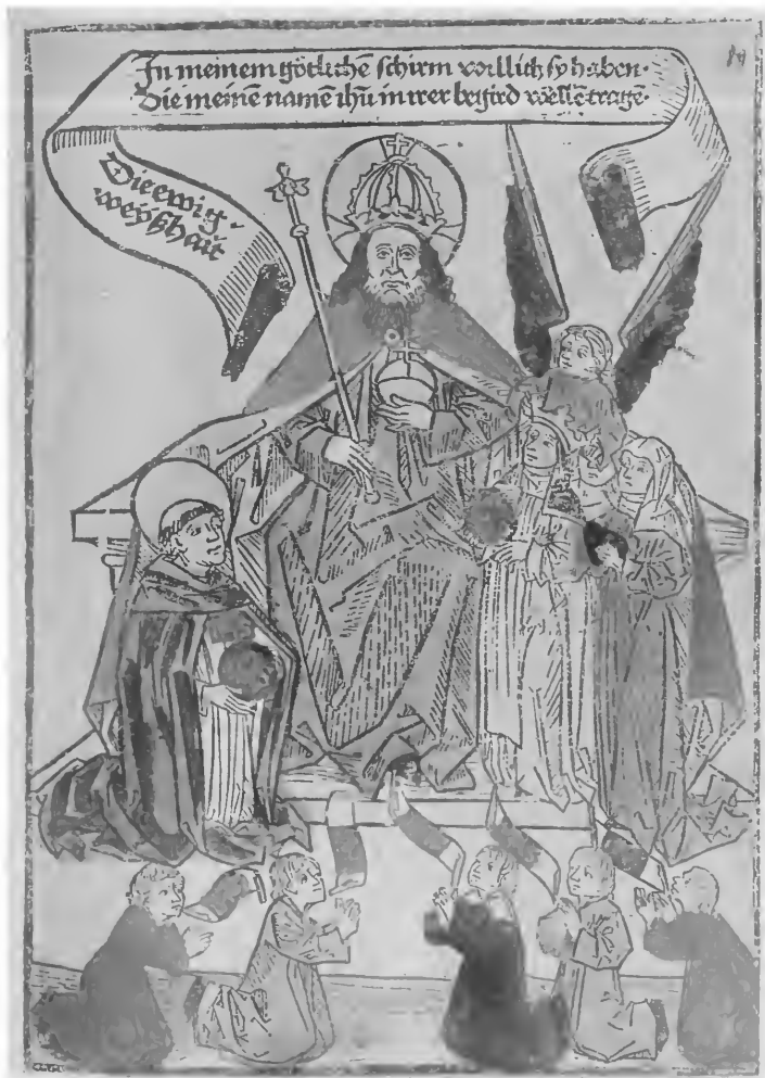
« Die ewig Weyshait » aus « der Seusse » Anton Sorg 1482 (Vat. Rossiano 572, fol. 89 r.).