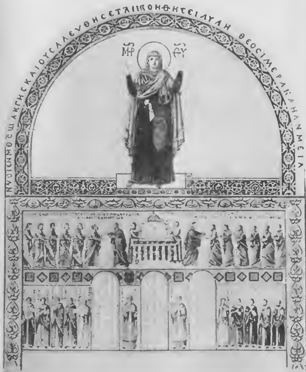
Apsismosaik der Sophienkirche in Kiew (XI. Jahrh.).