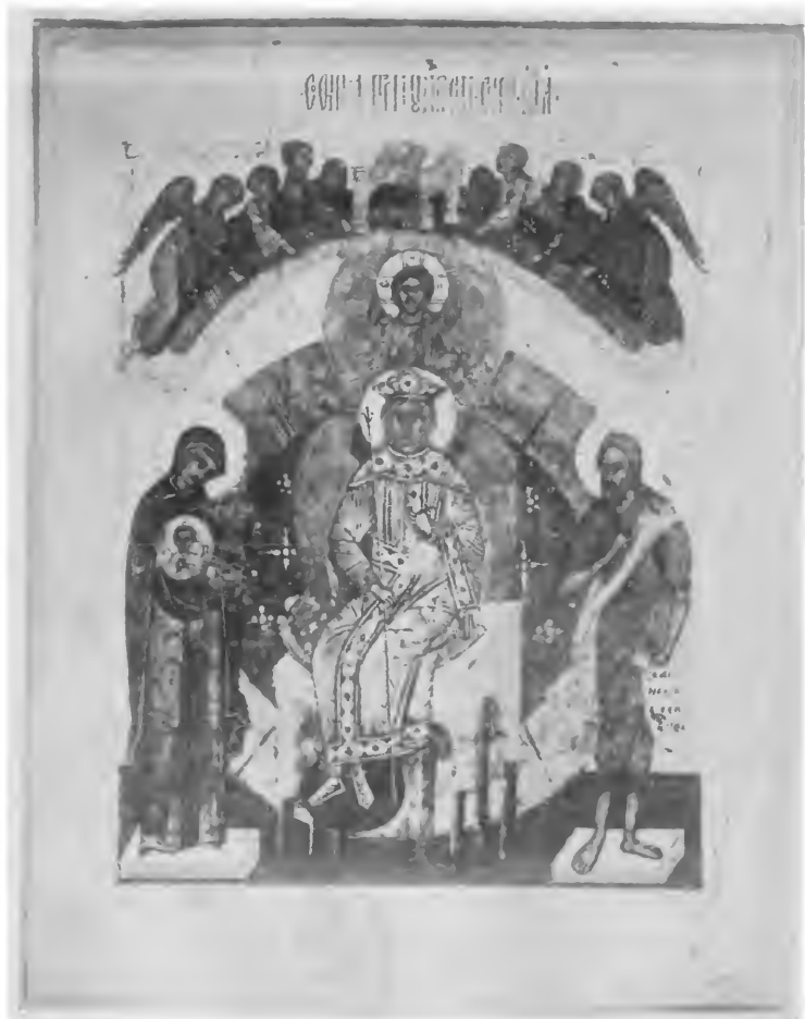
Zimmer-ikone nach dem Sophienbild in der Altarwand der Sophienkirche von Grossnowgorod.